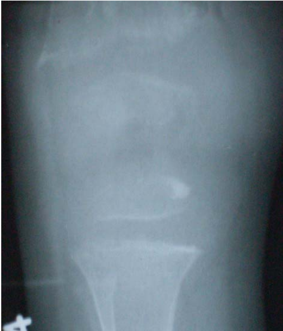
Figura 3. Radiografía que muestra el ensanchamiento de la línea epifisaria de fémur y tibia, aunque la radiografía muestra la rodilla derecha es bilateral.