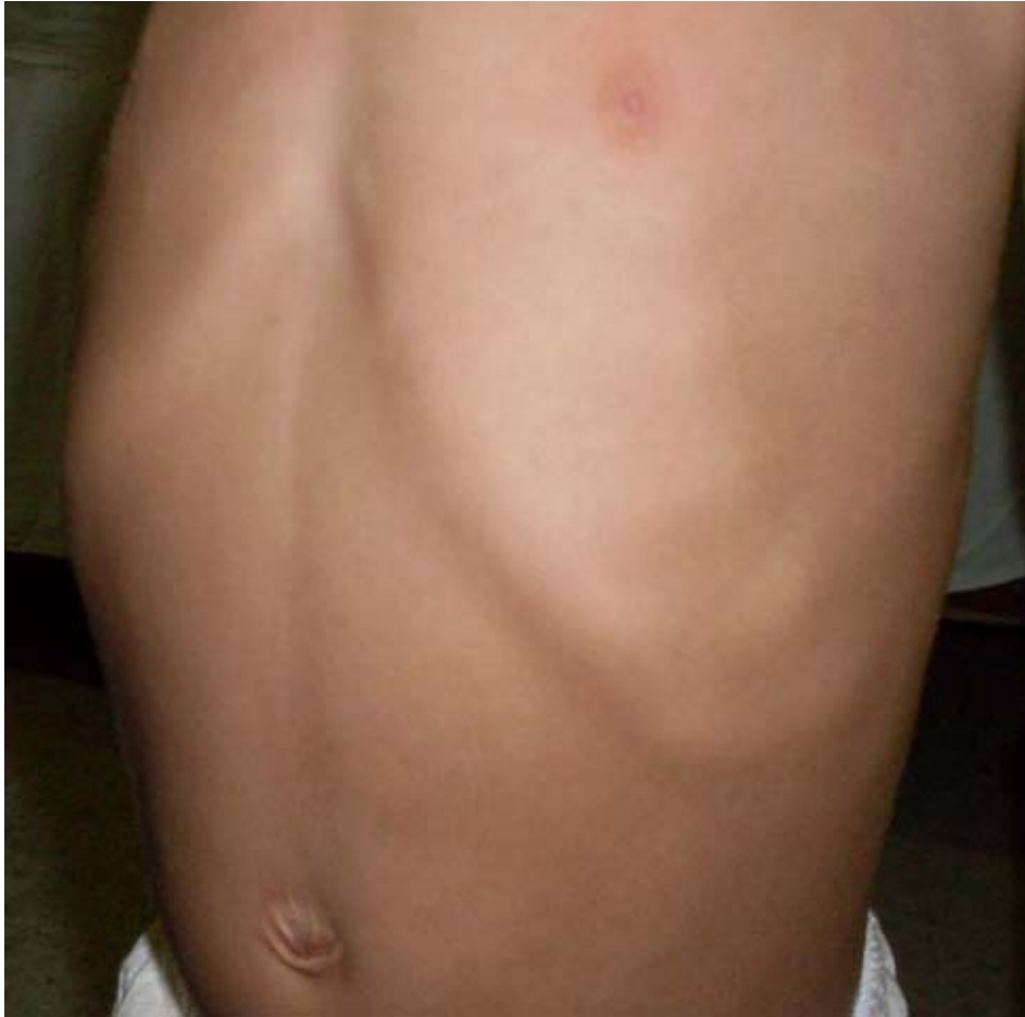
Figura 2. Se observa hipercrecimiento en las uniones costocondrales del tórax (rosario raquídeo).