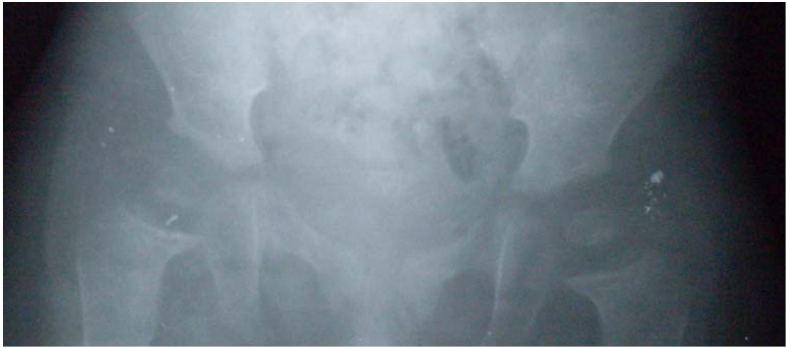
Figura 4. Radiografía de pelvis ósea muestra ensanchamiento de la línea epifisiaria de ambas caderas.