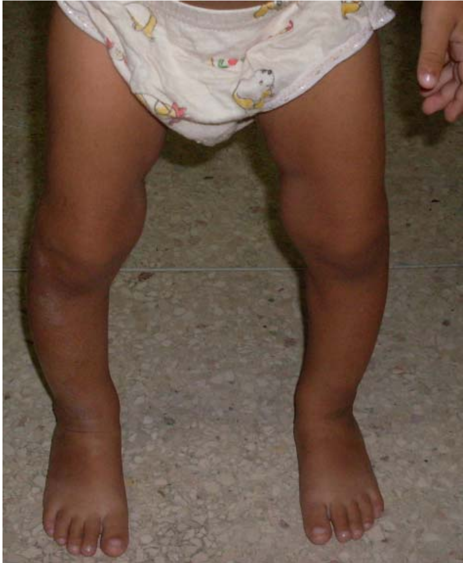
Figura 1. Genu varus en paciente raquítico.