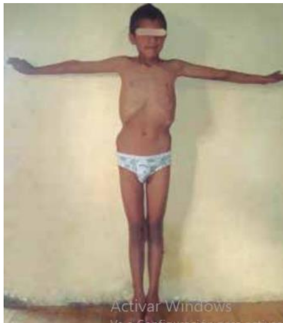
Fig. 1. Dolicoostenomelia (extremidades elongadas en relación a las dimensiones del tronco), escaso panículo adiposo, gran envergadura, asimetría pectoral.

Examen físico: dolicoostenomelia (extremidades elongadas en relación a las dimensiones del tronco), escaso panículo adiposo, gran envergadura, asimetría pectoral, como se muestra en la Figura 1. También se notó dolicocefalia y paladar ojival (Figura 2). A la auscultación se encontró soplo corto en foco aórtico accesorio.