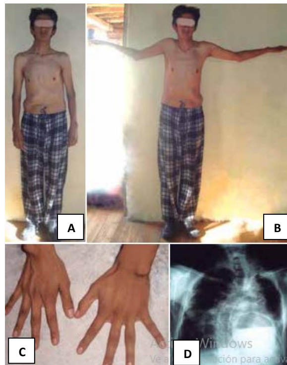
Fig. 3. Padre. 3A y 3B. Dolichostenomelia, dificultad para extensión de codo, asimetría de tórax ( pectus carinatum ). 3C. Arachnodactilia (falanges anormalmente largas) 3D. Escoliosis con presencia de bula, fibrosis cicatricial posttuberculosis.

Padre de 32 años (Figura 3), diagnosticado de MFS en su juventud (Cardiología: diámetro aumentado de raíz aórtica de 4,6 cm, con 55 % de fracción de eyección, soplo diastólico en foco aórtico. Neumología: antecedente de tuberculosis pulmonar, deformidad torácica con crecimiento de cartílagos esternocostales derecho, se ha realizado controles seriadados de tomografía axial computarizada y mostró bula que ha evolucionado y desplazó estructuras vecinas; presentó fibrosis cicatricial bilateral severa, además, de reporte espirométrico con patrón restrictivo severo. Ortopedia: escoliosis).