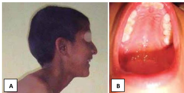
Fig. 2A. Dolicocefalia y 2B. paladar ojival.