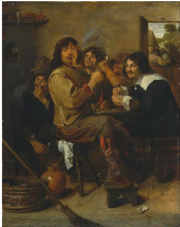
Figura 1. "El fumador". Adriaen Brouwer. 1636

Muchos son los pintores que reflejan a través de sus obras el tema de la drogadicción, uno de ellos fue el flamenco Adriaen Brouwer, exponente del movimiento artístico Barroco, quien creó un cuadro cuyo nombre es "El Fumador" en el año 1636 (Figura 1).