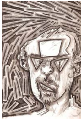
Fig. 4 Autorretrato. Valium