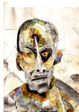
Fig. 8 Autorretrato Sales de baño

El propio Saunders declaró en una ocasión en su página web: