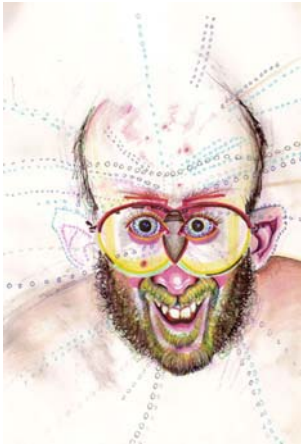
Fig. 3 Autorretrato. Hongos de psilocibina