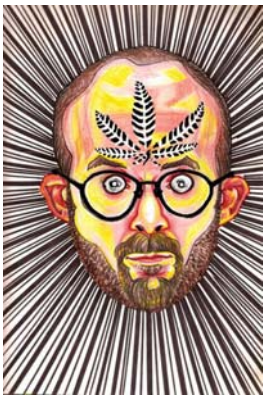
Fig. 6 Autorretrato. Marihuana