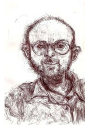
Fig. 5 Autorretrato Gasolina