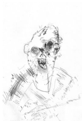
Fig. 7 Autorretrato. Morfina