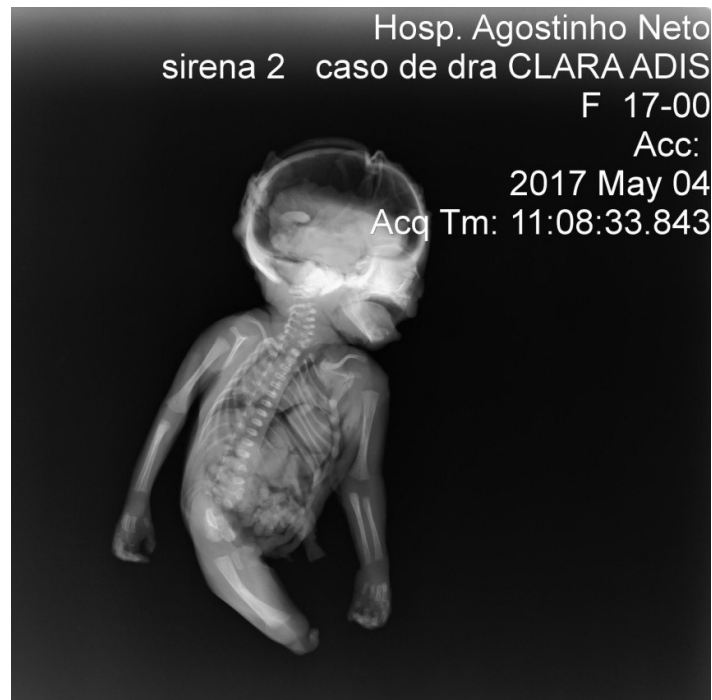
Fig. 2. Radiografía que sugiere probable hipoplasia pulmonar, presencia de hemivértabras, ausencia de sacro. Fémur único y ausencia de tibia y peroné.

El estudio de necropsia fetal posibilitó el siguiente informe anatomopatológico: