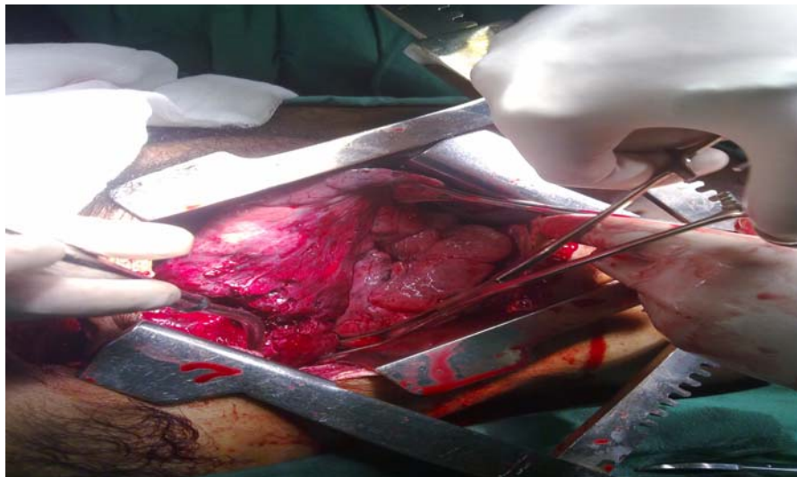
Figura 1. Herida anfractuosa transfixiante del lóbulo superior del pulmón derecho.

Después de cuidados preoperatorios de emergencia se comienza toracotomía anterolateral derecha confirmando herida penetrante en el tórax, transfixiante y anfractuosa en el lóbulo superior del pulmón derecho (Figura 1), fracturas costales de casi la totalidad de las costilla con fragmentos libre en el tórax, así como vasos intercostales con sangramiento activo. Se le realizó lobectomía superior derecha, ligadura de vasos sangrantes, síntesis de los arcos costales con alambre, fijación de la pared torácica con dos fijadores en sentido vertical y drenaje de la cavidad torácica (Figura 2).